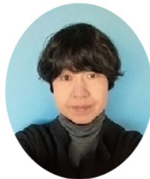
岡山地区 ときわした いっこ 常盤下 乙子

可愛かった息子たちもそれぞれ独立し、夫と二人きりの生活が始まり数ヶ月。帰宅後は、ビールを片手にただ二人でテレビなんかを見ながら一日が終わる感じです。こんな呑気な暮らしは、初めてのような気がします。やっと心にゆとりと言うものができたのでしょうか。すると、次男から「仕事を辞めたい」のお知らせ。エー!?!今一!?!何一!?!しばらくはゆっくり出来そうにありません。他人の転職と関わりながら仕事をしているはずなのに…我が息子となると…。