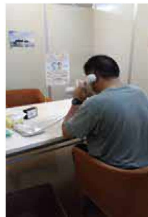
↑電話相談中の一コマ

次年度に向けては、取り組みそのものが時流に合っているのか、広報活動は充分であったか等の課題はありますが、お電話をくださったお一人お一人の悩みに真摯な姿勢で熱心に耳を傾けることの意味を考えますと必ずしも件数だけでは図れない大きな使命があるようにも思います。